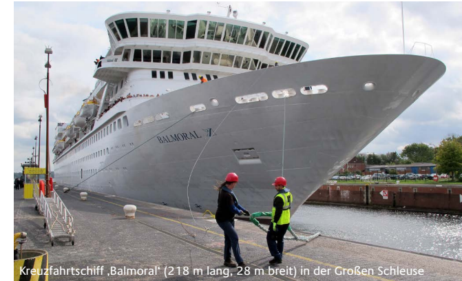
Kreuzfahrtschiff ‚Balmoral‘ (218 m lang, 28 m breit) in der Großen Schleuse

Wir wünschen Ihnen einen interessanten Aufenthalt auf unserer Aussichtsplattform.