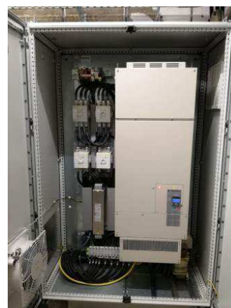
Schaltschrank des neuen Frequenzumformers