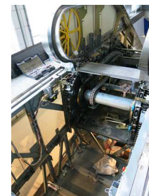
Einbauort der neuen Antriebseinheit